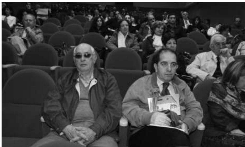
Pubblico presente alla cerimonia di premiazione del XI concorso

Questa poesia racchiude in sé il fuoco inestinguibile dell'amore.