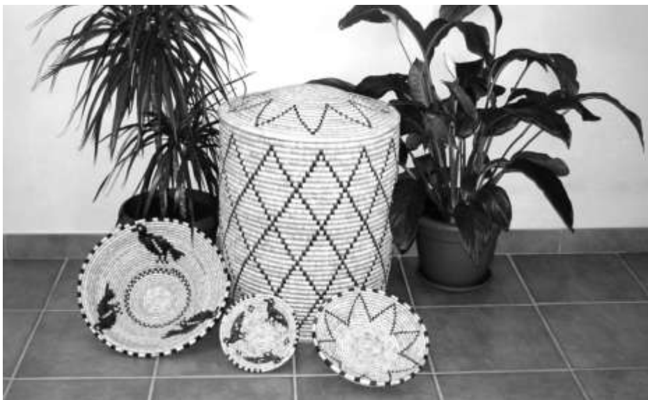
Lartigianato artistico di Tergu è specializzato nell'intreccio e nella produzione di cestineria

Il poeta scioglie dunque queste remore e si libra nell'aria di una vita che riesce a rinnovarsi, proprio come la sua poesia: che pur nella continuità sa trovare sempre uno scatto per migliorarsi e svelare un di più di senso.