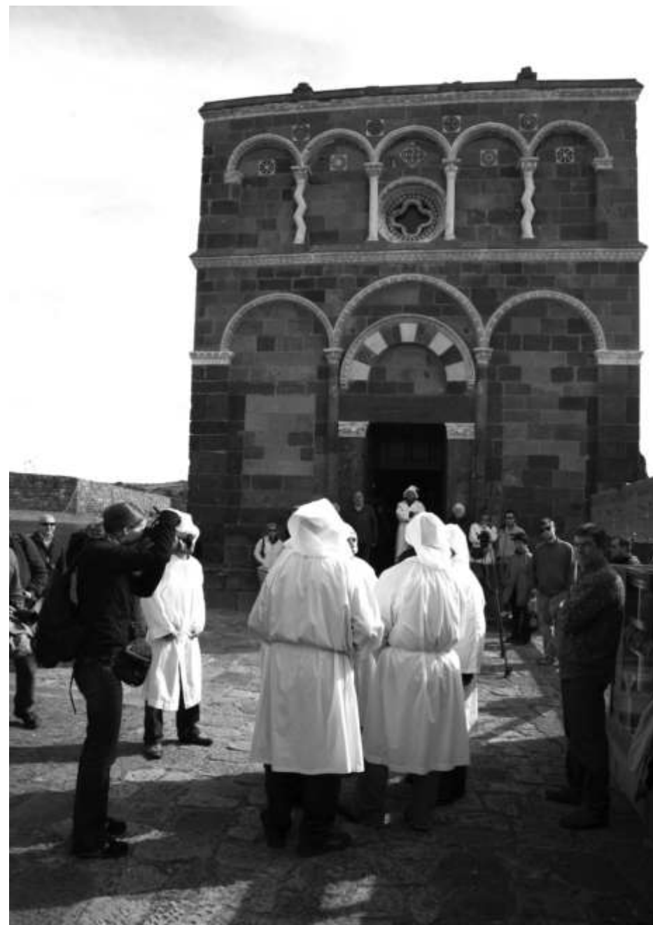
Abbazia di Nostra Signora di Tergu

L'artigianato artistico è specializzato nell'intreccio e nella produzione di cestineria.