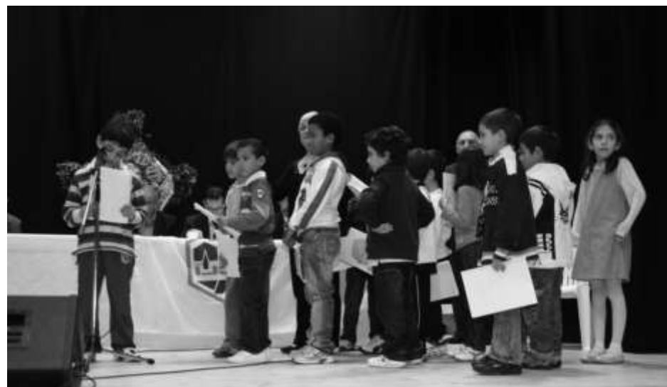
Alunni della Scuola Elementare di Silius