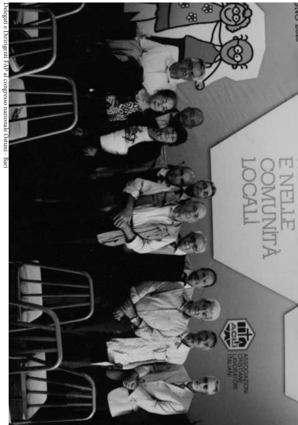
Delegati e Dirigenti FAP al congresso nazionale Ostuni - Bari